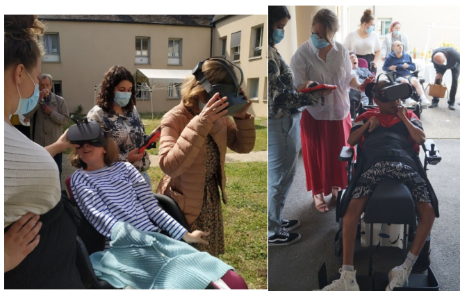
2 Casques à réalité Virtuelle pour la MAS Guynemer de La-Queue-Lez-Yvelines. Soit 16 Tonnes de Bouchons.