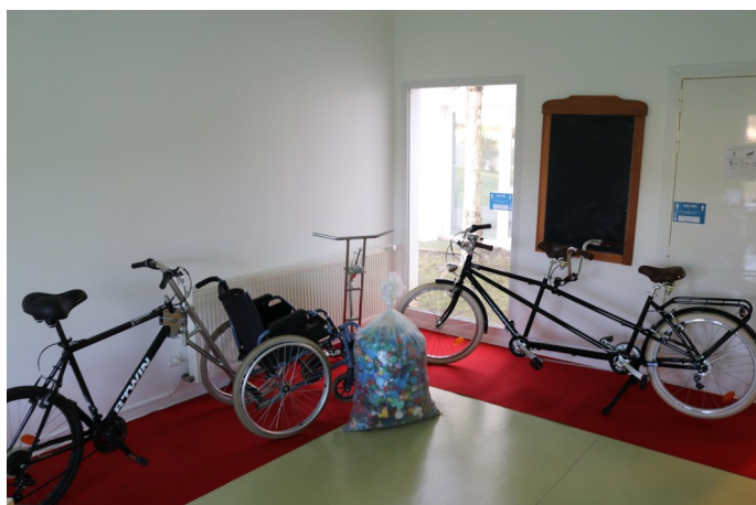
2 Guidons qui relient le vélo au fauteuil manuel et un tandem. Pour la MAS de Combs-la-Ville. Soit 15 Tonnes de Bouchons.

Grâce à vos bouchons l'Association a pu financer ces matériels durant l'année scolaire 2021 /2022.