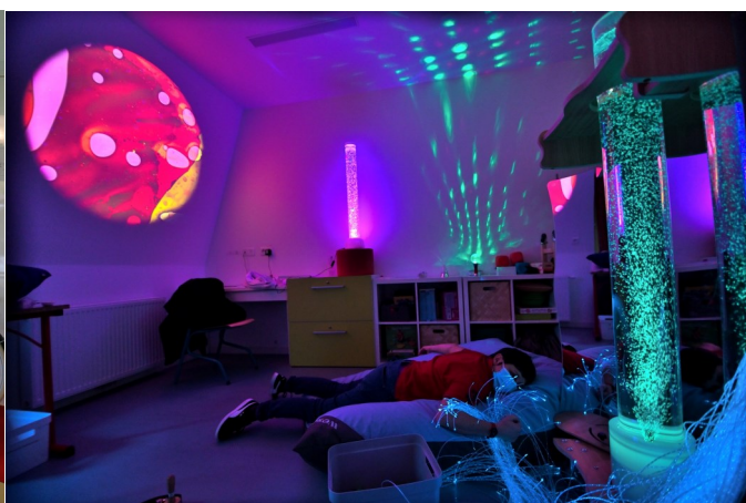
Du matériel Snoezelen. Pour l'IEM Claire Girard de Viroflay. Soit 18 Tonnes de bouchons.