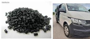
Tout le plastique automobile